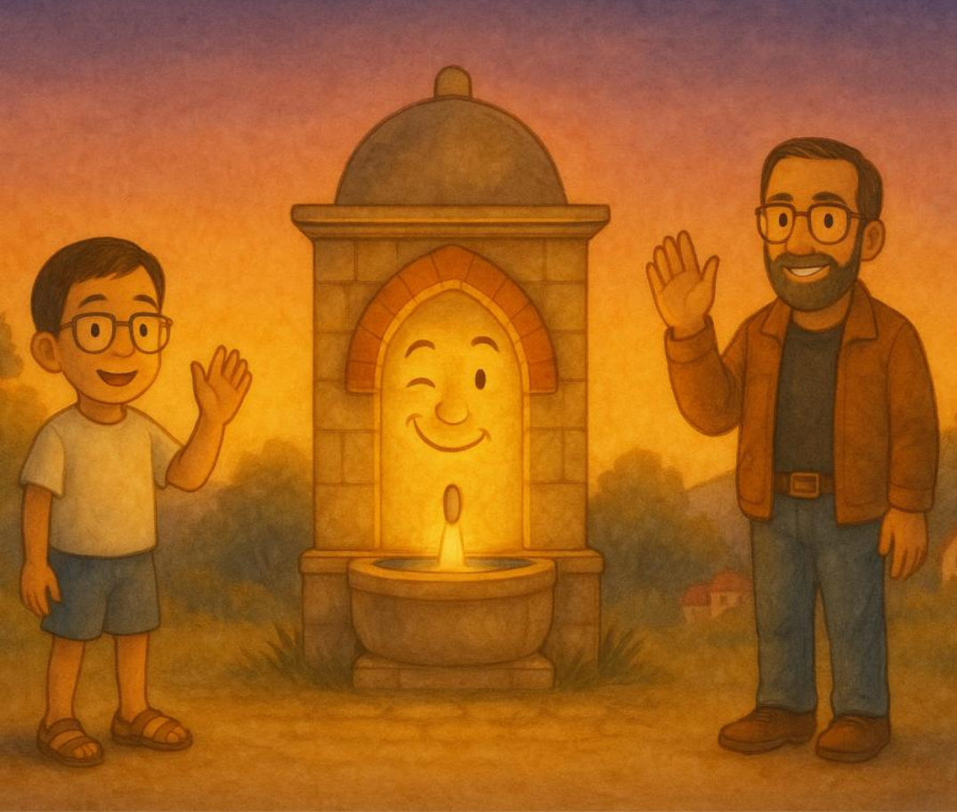
Çeşme'nin Bilge Çeşmesi